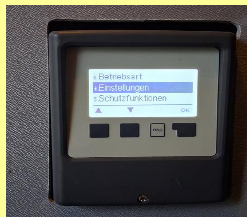
Einstellung Trinkwassertemperatur am Bolier