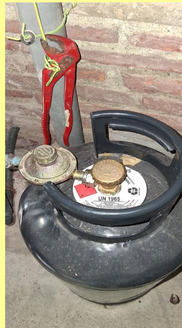
Gasflasche auf: Rechtes Rädchen nach links drehen