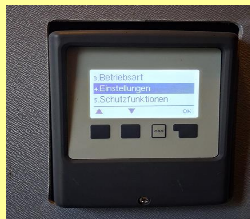
Einstellung Trinkwassertemperatur am Bolier