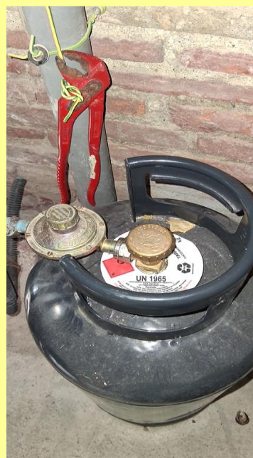
Aprire gas: aprire rotella verso sinistra