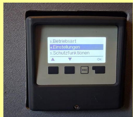
Impostazione della temperatura dell'acqua potabile