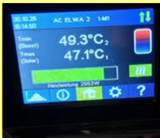
Impostazione della temperature acqua calda boiler all'elemento riscaldante

Se la temperatura dell'acqua calda non è sufficiente: Contattateci. Solitamente possiamo regolare le impostazioni dell'acqua calda tramite Wi-Fi. Vi preghiamo di non modificare le impostazioni autonomamente (o solo dopo averci consultato!).